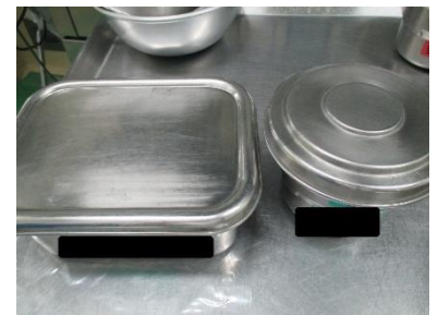
除去食容器と食札